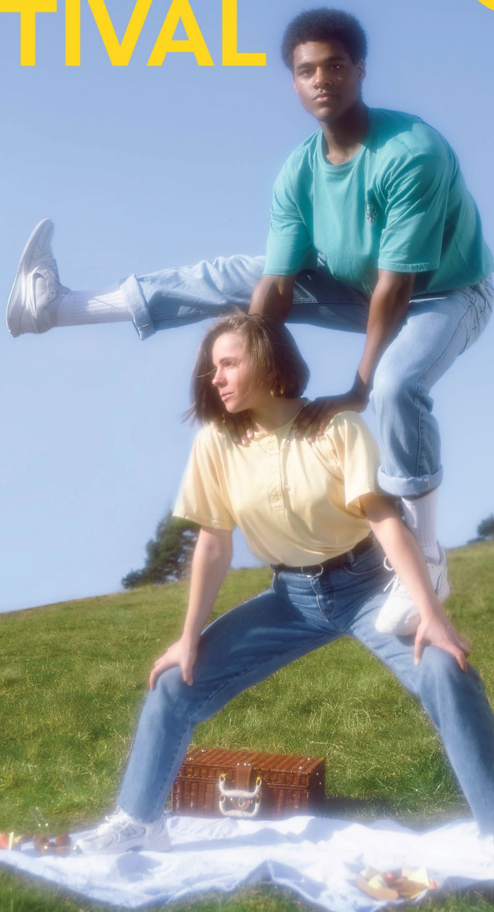
Design: Esmée Dros

26 * 27 * 28 * 29 MEI 2022 vrij toegankelijk