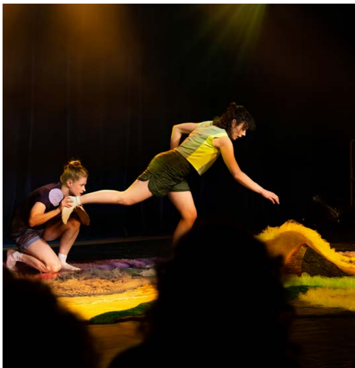
Danscollectief MAN || Co

In 2023 bereikte het Hoogte80 Festival een zeer divers publiek in herkomst, sociale klasse, culturele voorkeur en leeftijd. De bezoekers zijn bereikt door het programma op instaptredes, het laagdrempelige karakter van het festival en het gevoerde prijsbeleid.