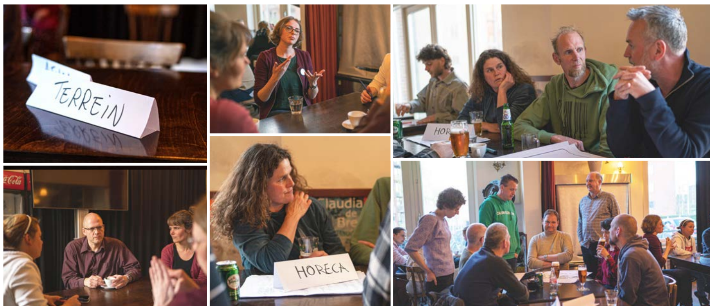
Hoogte80 Cafe met gebarentolk en ervaringsdeskundige