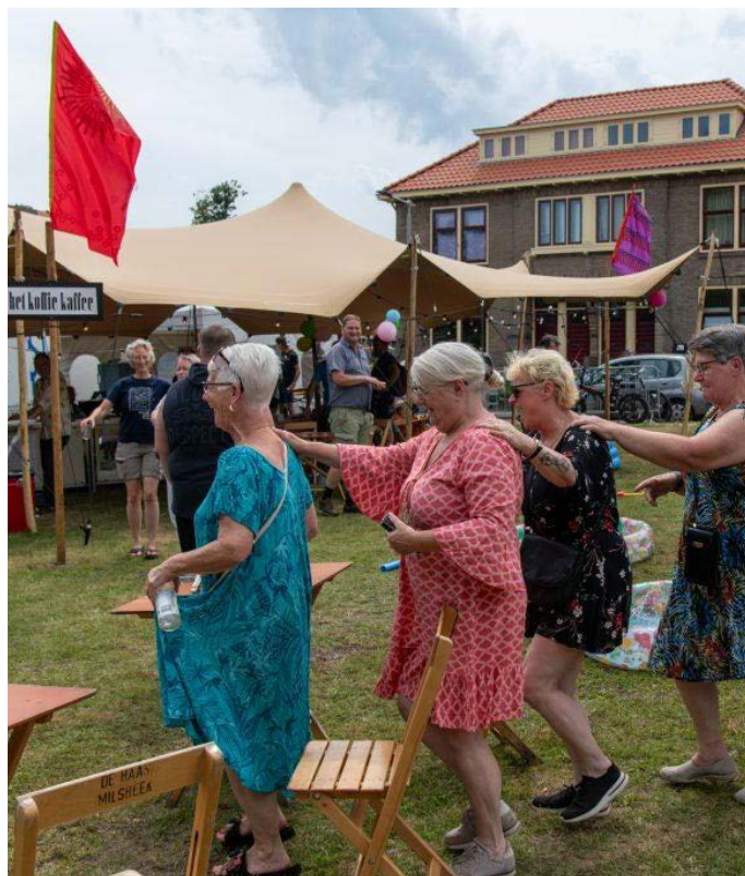
Podium van de Wijk