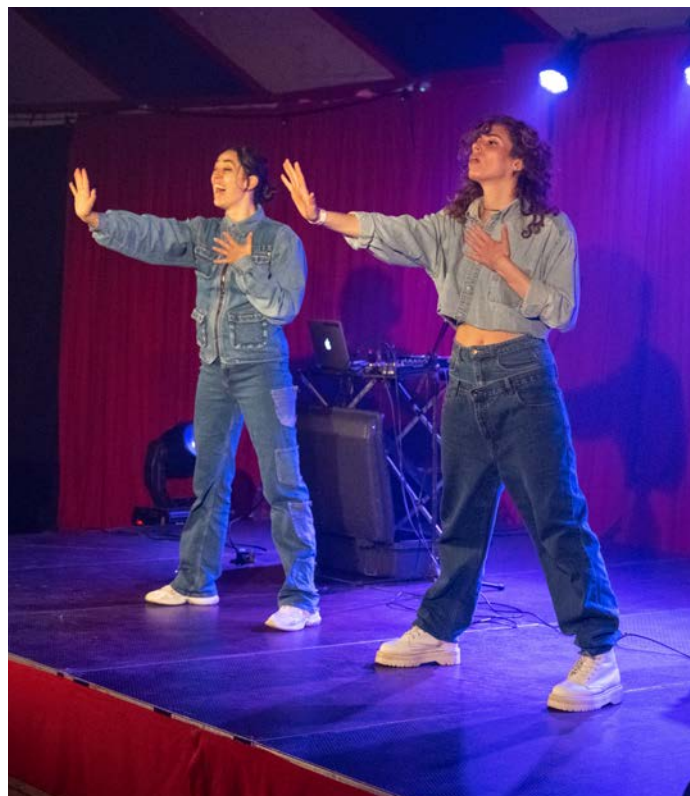
De Gestampte Meisjes